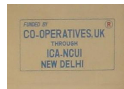
Un bâtiment reconstruit grâce aux fonds de Co-operatives UK et assisté par l'ACI et NCUI. La photo d'en haut représente un panneau sur le bâtiment indiquant la source de financement.