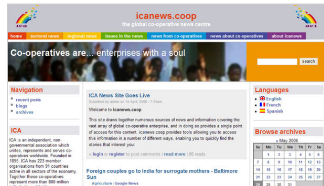
Visit ICA new news site www.icanews.coop

Vous pourrez accéder aux nouvelles sur www.icanews.coop de plusieurs manières :