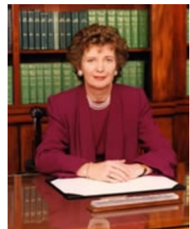
Ancienne Présidente Irlandaise, Mary Robinson, Intervenant à la Conférence de WOCCU

Voir ci-dessous quelques activités coopératives qui nous ont été communiquées par nos membres japonais.