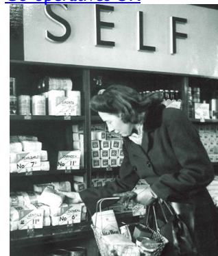
Une des milliers de photos conservées dans la collection britannique

contacter Mervyn Wilson Mervyn@co-op.ac.uk et consulter le site web de: Co-operatives UK