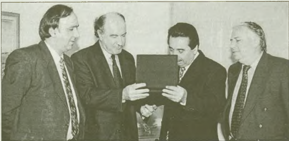
Από την επίσκεψη του Υπουργού Γεωργίας κ. Γ. Ανωμερίτη στο εργοστάσιο της ΣΕΚΑΠ στην Ξάνθη (29-1-99). Ο Πρόεδρος της ΣΕΚΑΠ κ. Ηλ. Σειτανίδης προσφέρει αναμνηστική πλακέτα στον Υπουργό.

γ) στη θέσπιση και εφαρμογή οργανωτικών, οικονομικών κανόνων και διαφανών διαδικασιών που σχετίζονται με όλες τις λειτουργίες της εταιρείας,