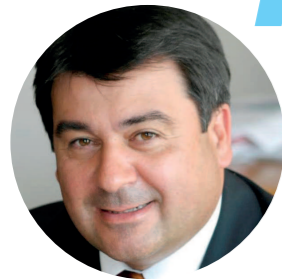
Petar Stefanov, Πρόεδρος της Παγκόσμιας Οργάνωσης των Συνεταιρισμών των Καταναλωτών

Σε αυτό το ειδικό τμήμα της Παρατηρητηρίου, παρουσιάζονται τέσσερις ιστορίες συνεταιρισμών καταναλωτών: Alleanza 3,0 (Ιταλία), iCoop Κορέα (Δημοκρατία της Κορέας), NCG / CoMetrics (ΗΠΑ), και JCCU (Ιαπωνία). Αυτές οι τέσσερις ιστορίες επιλέχθηκαν για να προβάλουν κάποιες ενδιαφέρουσες πρωτοβουλίες που έχουν αναληφθεί από τους συνεταιρισμούς καταναλωτών σε όλο τον κόσμο, τόσο μεγάλων όσο και μικρών. Μετά τις ιστορίες αυτές είναι μια συνέντευξη με τον Πέταρ Στεφάνοφ, νυν Πρόεδρο της CCW και της Κεντρικής Συνεταιριστική Ένωση Βουλγαρίας.