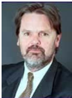
Garry Cronan Redactor:

Todas las nominaciones deberán ser mandadas al Director General de la ACI antes del 13 de junio del 2005.