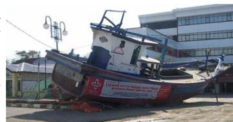
La oficina de la KUD, destruida totalmente por olas de agua de 30 metros de alto – solo el piso de baldosa roja quedó intacto.

“Fue una decisión de segundos que tenía que tomar, de cruzar bruscamente a la izquierda o a la derecha para escapar las montañas de agua que se levantaban enfrente de él...”