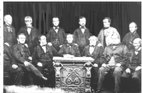
Los pioneros de Rochdale.

considerará y entregará el premio durante la Asamblea General de la ACI en septiembre.