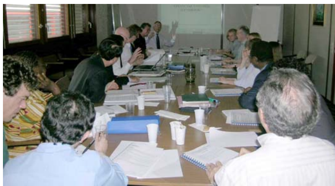
Los participantes justo antes de firmar el acuerdo de compromiso