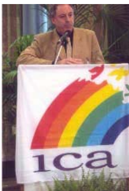
El Dr. Birchall explorando la conexión entre los principios cooperativos y el éxito en una economía globalizada.

"...oradores globales líderes y talleres enfocados hacia lo práctico son características de la Asamblea General de este año."