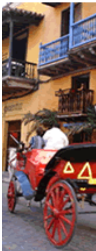
Cartagena es famosa por sus edificios coloniales y medievales.

Cartagena tiene mucho que ofrecerles a sus visitantes.