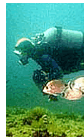
Si le gustan las playas o los deportes acuáticos, ¡Entonces disfrutará de Cartagena!