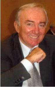
Presidente Ivano Barberini Italia

Ahora hay cinco miembros mujeres en el Consejo – ¡el porcentaje más alto en la historia!