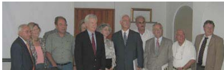
Miembros de la ACI Vivienda durante una reunión en Cartagena.

Para más información sobre las actividades de la TICA en la Asamblea General y de forma más general por favor comuníquese a mdavo@tin.it o visite el sitio Web