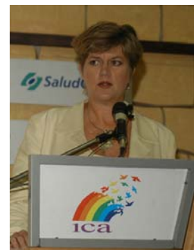
Sherron Watkins, “el ignorar los valores, la ética y las responsabilidades fundamentales pueden llevar a cualquier negocio exitoso a la ruina.”

José Manuel Salazar-Xirinachs “los valores, las actividades y las estructuras de las cooperativas encarnan mucho de lo que es importante en hacer más justa la globalización.”