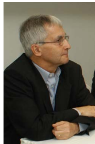
El Director General de la ACI, Iain Macdonald, satisfecho con el resultado de la Asamblea General

Esto encajó bien con el énfasis general que se le dio al gobierno con la adaptación unánime del informe de nuestro grupo de trabajo – un elemento esencial en cualquier organización cooperativa.