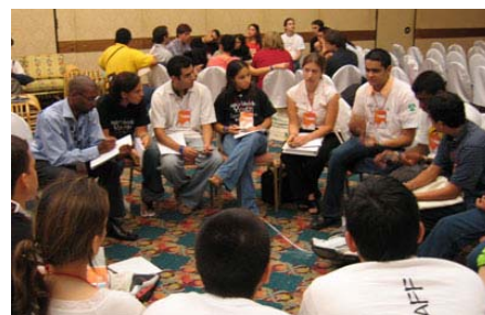
Delegados de la juventud durante una de sus sesiones de taller en Cartagena

Red de la Juventud de la ACI. La Red Global se está fortaleciendo, está formando agrupaciones regionales, está desarrollando planes y está celebrando y retando elecciones. En las futuras ediciones del Boletín habrá más información sobre la juventud.