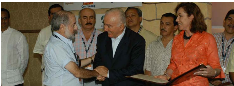
Al Presidente de la ACI, Ivano Barberini, se le presentó un reconocimiento especial de parte del gobierno colombiano y de la Comisión del Senado sobre Relaciones Internacionales, honrando sus servicios hacia el movimiento global. El premio lo presenta el Sr. Higueta.

Durante los próximos meses, las ACI estará entrevistando a los nominados y a los ganadores del Premio de los Pioneros de Rochdale.