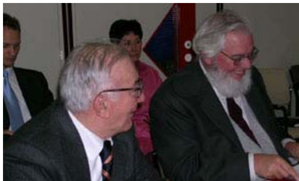
El Presidente de la ACI, Ivano Barberini, y el Director General de la OIT, Juan Somavia, comparten un momento de diversión durante la reunión aniversario

La evaluación concluyó que se había logrado un progreso importante en un número de áreas claves bajo el MoU. También se sugirieron y discutieron varias posibles áreas de colaboración.