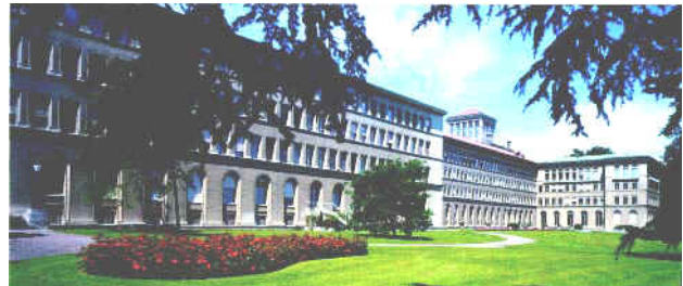
Las oficinas principales de la OMC quedan en Ginebra, cerca de las oficinas principales de la ACI

les da, especialmente a las cooperativas que organizan a grandes segmentos del mercado.