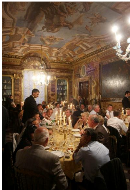
Palazzo Taverna, sede de la Cena de Gala de la AG