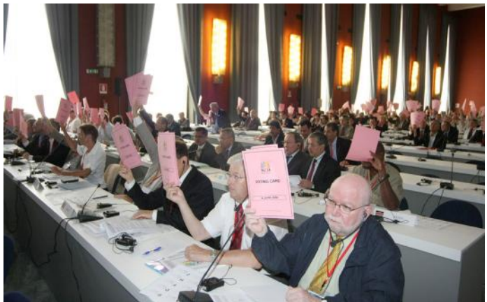
Los delegados votando en la Asamblea