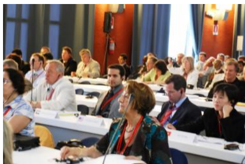
Delegados durante la Asamblea