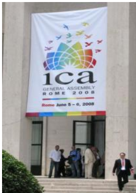
Salón de la Fuente