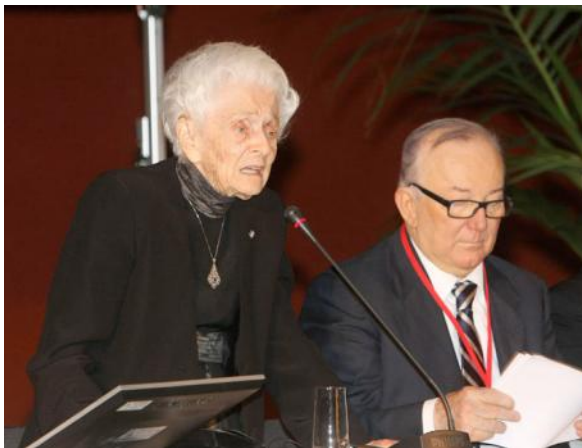
Rita Levi-Montalcini e Ivano Barberini

Rita Levi-Montalcini pronunció el discurso principal, centrándose en el constante fortalecimiento del movimiento cooperativo y de la necesidad de invertir en la educación de las mujeres para proveerlas de oportunidades para el desarrollo.