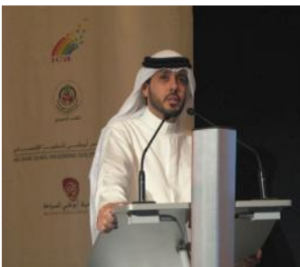
Al Suwaidi, Sub Secretario, Ministerio de Asuntos Sociales del Gobierno de Emiratos Árabes Unidos

Los Emiratos Árabes Unidos, el Ministerio de Asuntos Sociales de los EAU y ACI Asia-Pacífico, realizaron juntos un