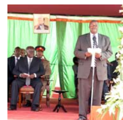
Stanley Muchiri dirigiendo el evento centenario con el Presidente Mwai Kibaki

A pesar del éxito, el Presidente Mwai Kibaki desafió al movimiento para promover el crecimiento continuo y alentó a los jóvenes a comprometerse en el movimiento cooperativo.