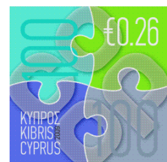
Estampilla conmemorativa que marca los 100 años desde la fundación de la primer cooperativa

Un renovado y modernizado movimiento cooperativo está, hoy en día, dedicado a servir a sus miembros y mejorar el bienestar público.