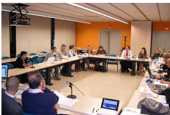
Foro Global de DRH en la Asamblea General de la ACI

Especialistas en Desarrollo de Recursos Humanos (HRD) se reunieron en Ginebra durante el foro global de desarrollo de los recursos humanos de la ACI para ampliar la red de desarrollo de los recursos humanos cooperativos. IRENET— la Social Enterprise European Net-