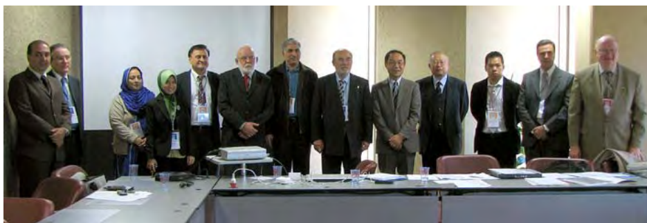
Miembros de IHCO en la Asamblea General del IHCO 2009

La International Health Cooperative Organization (IHCO) celebró su Asamblea General el 18 de noviembre del 2009, precediendo a la Asamblea General de la ACI.