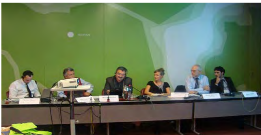
Foro de CICOPA en la Asamblea General de la ACI

C ICOPA, la organización sectorial de la ACI que reúne a las cooperativas industriales, de servicio, sociales y de artesanos, celebró su Asamblea General bienal seguido de un seminario sobre ambiente y la sostenibilidad en las cooperativas el 18 de noviembre del 2009.