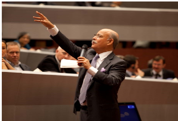
Jeremy Rifkin edifica a los líderes cooperativos en la AG de ACI del 2009

La creciente rigurosidad del cambio climático, evidenciado por una mayor comprensión e identificación de olas de retroalimentación y la falta de voluntad política de actuar aún hasta en los cálculos más conservadores, podría ver la extinción de la raza humana dentro de un siglo, dijo Rifkin. Las conversaciones sobre el ambiente de Copenhague ilustraron la necesidad de un cambio de paradigma. Los países defienden la posición geopolítica como medio para limitar su propia reducción de carbono, cuando necesitamos hacer la aspiración política 'el