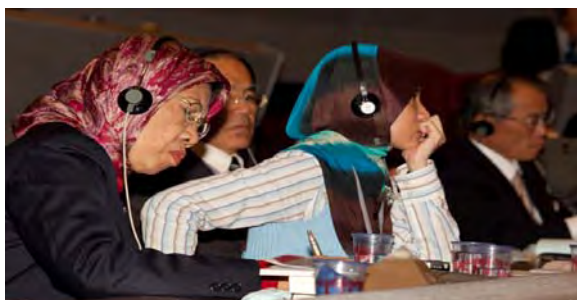
Los delegados de la Asamblea asisten a las sesiones de los paneles temáticos en la Asamblea General de la ACI del 2009.

El clima, la energía y la recuperación cooperativa fueron el foco de la Asamblea General de la ACI, comenzando con la edificante presentación inaugural del Profesor Jeremy Rifkin (ver el artículo en página 5).