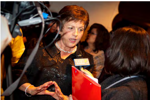
Dame Pauline Green siendo entrevistada por medios de comunicación italianos en la Asamblea General de la ACI 2009 en Ginebra

En su discurso de inauguración en la Asamblea con ocasión de su elección, Dame Pauline Green comentó sobre el "gran honor" de su nombramiento. Ella desafió a la ACI a cumplir con su gran potencial de empoderar a las personas y las comunidades, especialmente en este momento de necesidad mundial económica y ambiental.