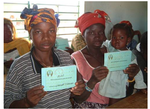
La photo ci-dessus montre des membres d'un système de micro financement au Burkina Faso.