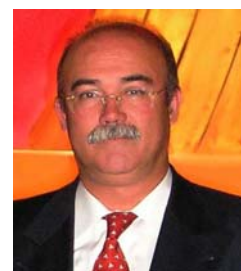
Il Dott. Guisado, mentre garantisce il suo sostegno ai colleghi operatori svedesi

Copie della rivista dell'IHCO si potranno trovare tra breve sul website dell'ACI.