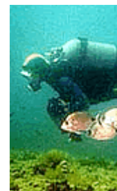
Se ti piacciono le spiagge e gli sport acquatici, ti divertirai a Cartagena