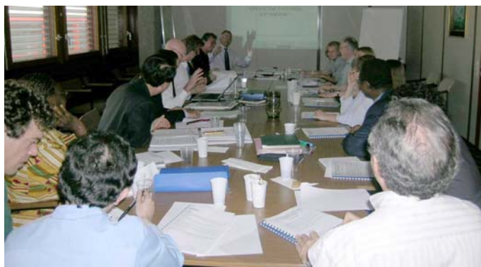
I partecipanti prima di firmare