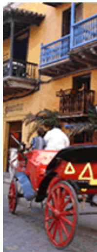
Cartagena é famosa pelos seus edifícios medieval e colonial.

Cartagena tem muito a oferecer ao visitante. Os delegados e seus acompanhantes terão a oportunidade de explorar uma das mais lindas e históricas cidades da América do Sul.