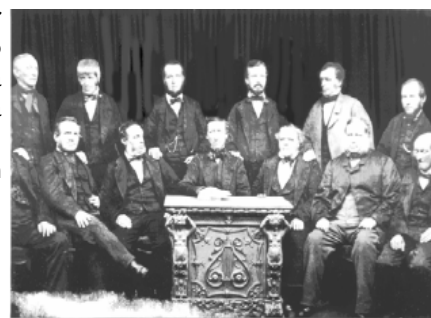
Os Pioneiros de Rochdale

ACI irá proceder a escolha e o prêmio será entregue na Assembléia Geral da ACI, em setembro.