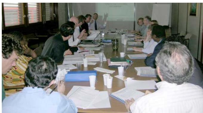
Participantes um pouco antes da assinatura do compromisso.