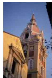
A cidade velha, Cartagena.

Um website especial da Assembléia Geral foi produzido pelas organizações anfitriãs. Está em espanhol e em inglês www.icacartagena.coop