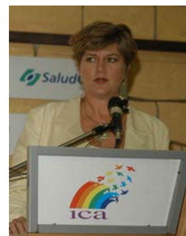
Sherron Watkins, “ignorar os valores fundamentais, a ética e as responsabilidades podem levar qualquer empresa de sucesso à falência e à ruína”

José Manuel Salazar-Xirinachs “os valores, atividades e estruturas das cooperativas incorporam muito do que é importante num mercado globalizado justo “