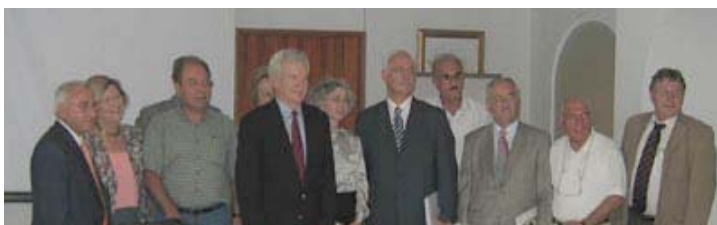
Membros da ACI HABITACIONAL, em sua reunião em Cartagena

Para maiores informações sobre ACI HABITACIONAL contate: mdoyle@chfhq.org ou visite seu website em www.icahousing.org/