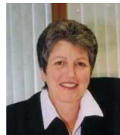
Vice-President Europe Pauline Green Reino Unido