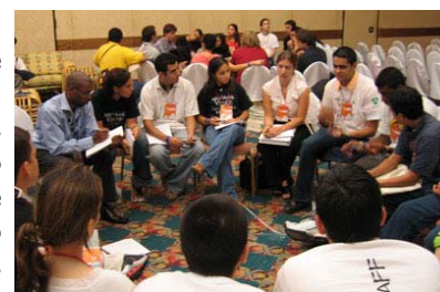
Jovens delegados em uma das sessões de workshop, em Cartagena

pela Rede de Juventude da ACI. A Rede Global está sendo fortalecida, os grupos regionais estão sendo formados, planos e programas estão sendo desenvolvidos, as eleições realizadas e disputadas. Maiores informações sobre a juventude serão publicadas nos futuros números do Boletim.