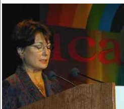
Ванда Джулиани, председатель Комитета МКА по равенству полов

По случаю празднования Международного женского дня в четверг 8 марта МКА опубликовал совместное заявление президента МКА и председателя его Комитета по равенству полов. Приводим выдержки из данного заявления: «Международный женский день стал днем, когда можно поразмышлять о положении в нашем мире с точки зрения равенства полов. В это году мы выбрали тему «Равенство