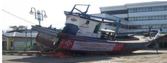
Большая лодка, вынесенная громадными волнами на бкм в город Банда