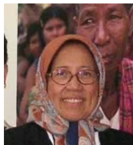
Сенатор Рахайя В. Бахеран (Малайзия)