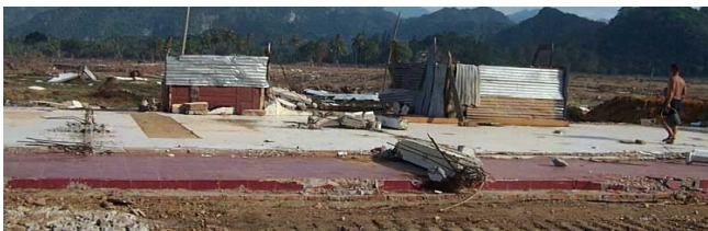
Офис KUD, полностью разрушенный 30-метровой волной, уцелел только пол, выложенный красной плиткой